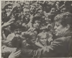
Riba e grafica aki e president ta ricibi un recepcion alegre na su parada entre Alemania Oriental y Occidental.

Europa, semper menazá - e caso reciente di Italia a demostra cu e peliger cual ta leuw di disminuá a acentua - mester tin e seguridad moral cu Merca ta y lo keda na su banda den e oranan difícel, mas ainda cu den esunnan di prosperidad. Si Merca stop di demostra interes pa Europa "the Old World", cura di nos civilizacion democratico cristiano